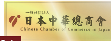
2012.4 一般社団法人に移行 / 一般社団法人化