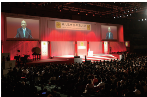
2007.9 第九回世界華商大会を神戸・大阪で成功裏に開催。国内外から3,600名が参加 / 于神戸・大阪成功主办第九届世界华商大会。海内外3,600多名来宾参会