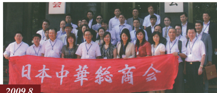
2009.8 初の中国視察団 / 首次组织中国视察团