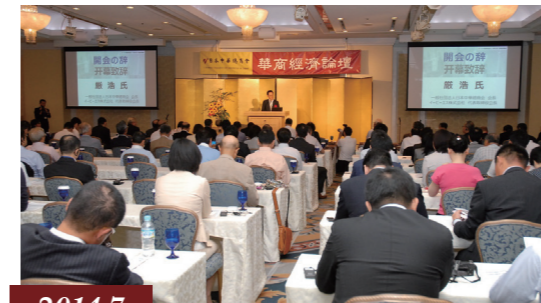
2014.7 第一回華商經濟フォーラムを開催 / 主办第一届华商经济论坛