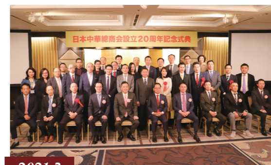
2021.3 設立20周年記念式典を開催 / 召开成立20周年庆典