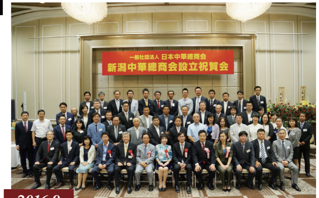
2016.9 新潟中華總商會設立 / 新潟中华总商会成立