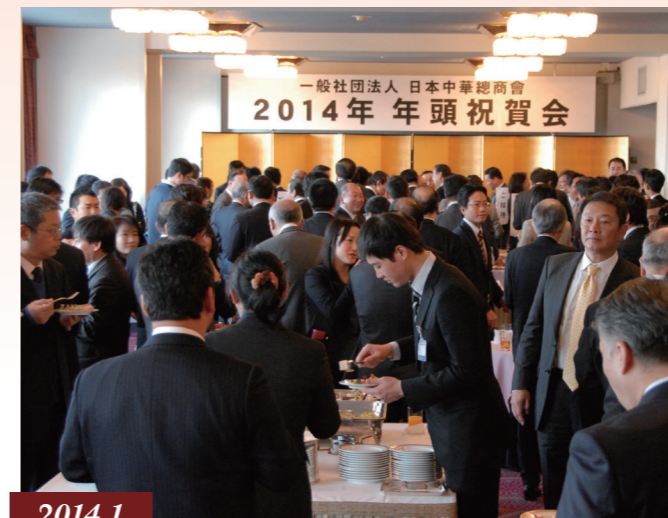
2014.1 初の年頭祝賀会(迎春会) / 首次举办迎春会