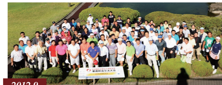
2012.9 第一回華商杯ゴルフ大会開催 / 举办首届华商杯高尔夫大赛