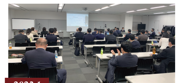
2023.1 社員総会にて理事会の拡大、評議員会設立等の議案を承認 / 会员大会通过扩大理事会、设立评议委员会等议案