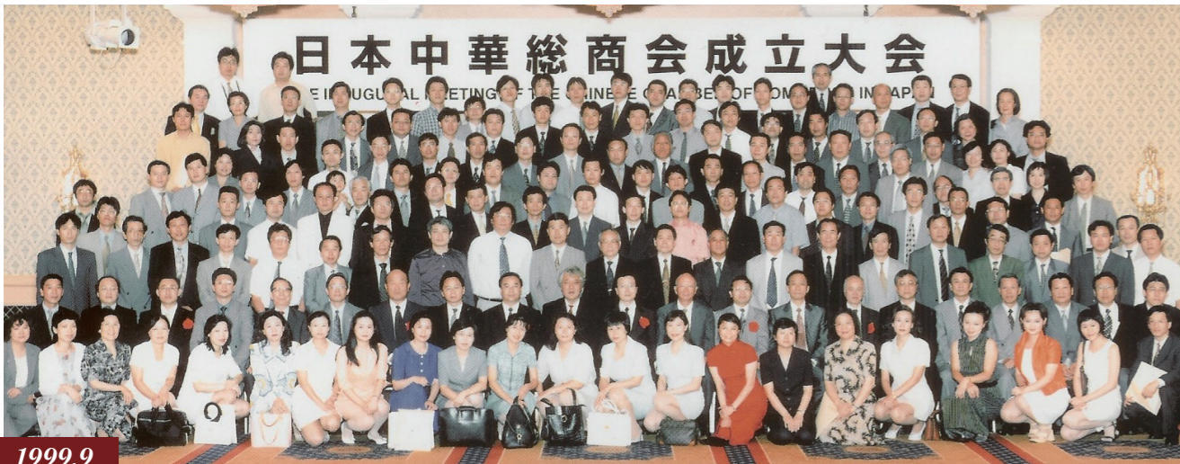
1999.9 日本中華總商會設立 / 日本中华总商会成立