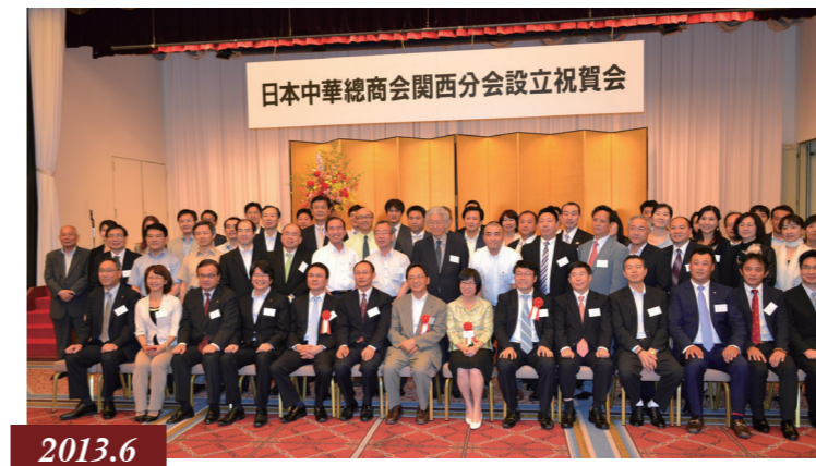
2013.6 関西中華總商會設立 / 关西中华总商会成立