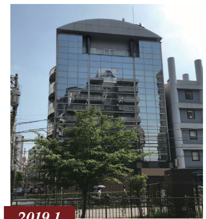
2019.1 本部を恵比寿新事務所に移転 / 总部移至惠比寿新办公楼