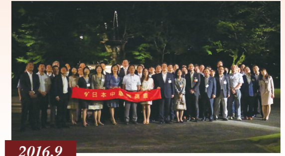
2016.9 賞月会を初開催、チャリティー事業 / 首次举办赏月会、慈善活动